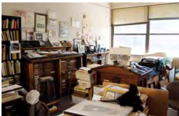
Ein Blick in die Werkstatt der „Greenwood Press“.