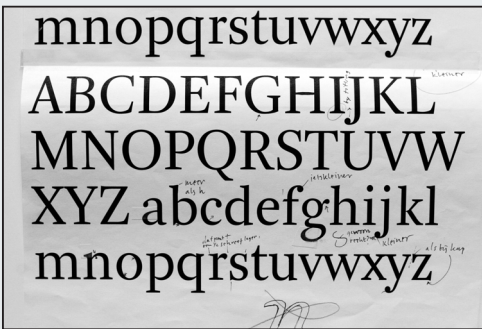
Der lange Weg zur gewünschten Form: eine Korrekturseite zur Veranschaulichung des Designprozesses

Die Arnheim-Schriftfamilie ist im Mac/PostScript-, PC/PostScript- und PC/TrueType- sowie im plattformunabhängigen OpenType-Format erhältlich. Nähere Informationen unter der in jedem Fall besuchenswerten Internetadresse www.ourtype.be .