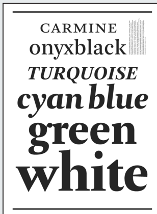
Aus dem Schriftmuster zur Arnhem, gestaltet von C. Cotorobai

plettiert wird die Arnheim-Schriftfamilie durch Kapitalälchen, kursive Kapitalälchen und diverse Ziffernformen.