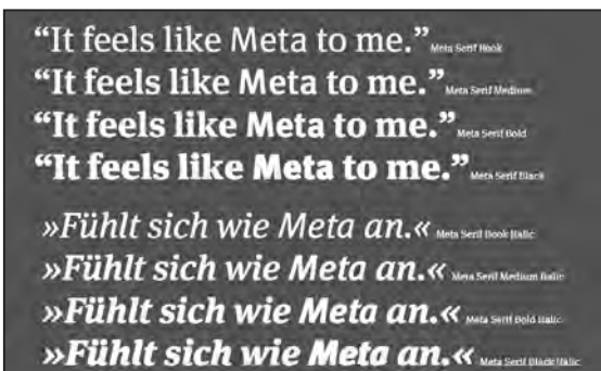
Die Meta Serif gibt es in den Schnitten Book, Medium, Bold und Black jeweils mit kursiver.

richtig, und die beiden Schriften passten nicht wirklich zusammen.“