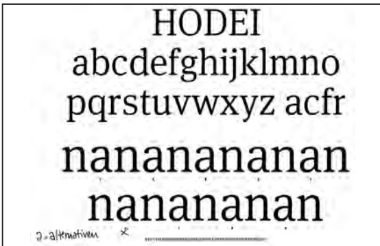
Experimente an den Buchstaben n und a zur Abschätzung von Zeichenform beziehungsweise Serifen.